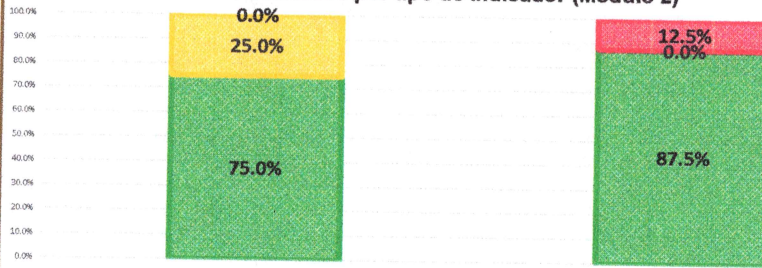
Guía Consultiva de Desempeño Municipal Resultados por tipo de indicador (Módulo 2)