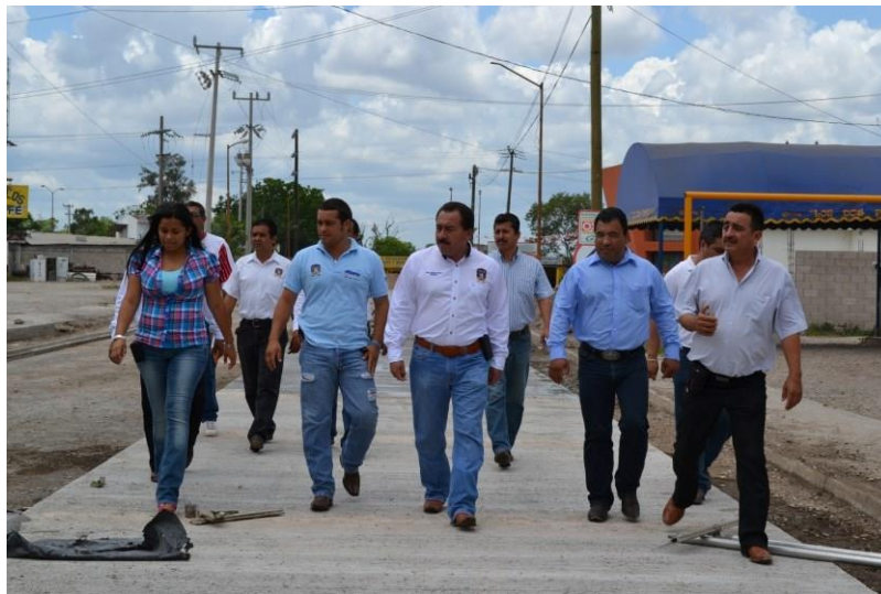
Parques y jardines

Se realizaron diariamente actividades de limpieza en las áreas verdes del municipio que incluyen: la plaza bicentenario, Plaza Juárez, Plaza Y Parque Infantil De La Col. Constitución, Placita De