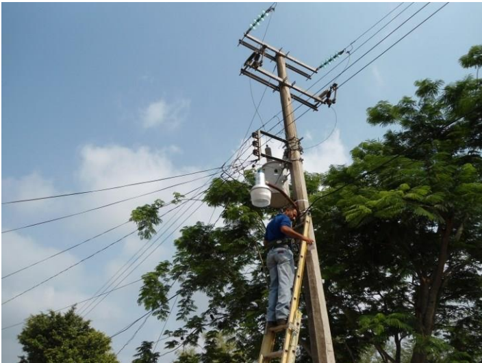
Mantenimiento de la vía pública

Se ha brindado apoyo a 5 instituciones educativas que requirieron de mantenimiento eléctrico.