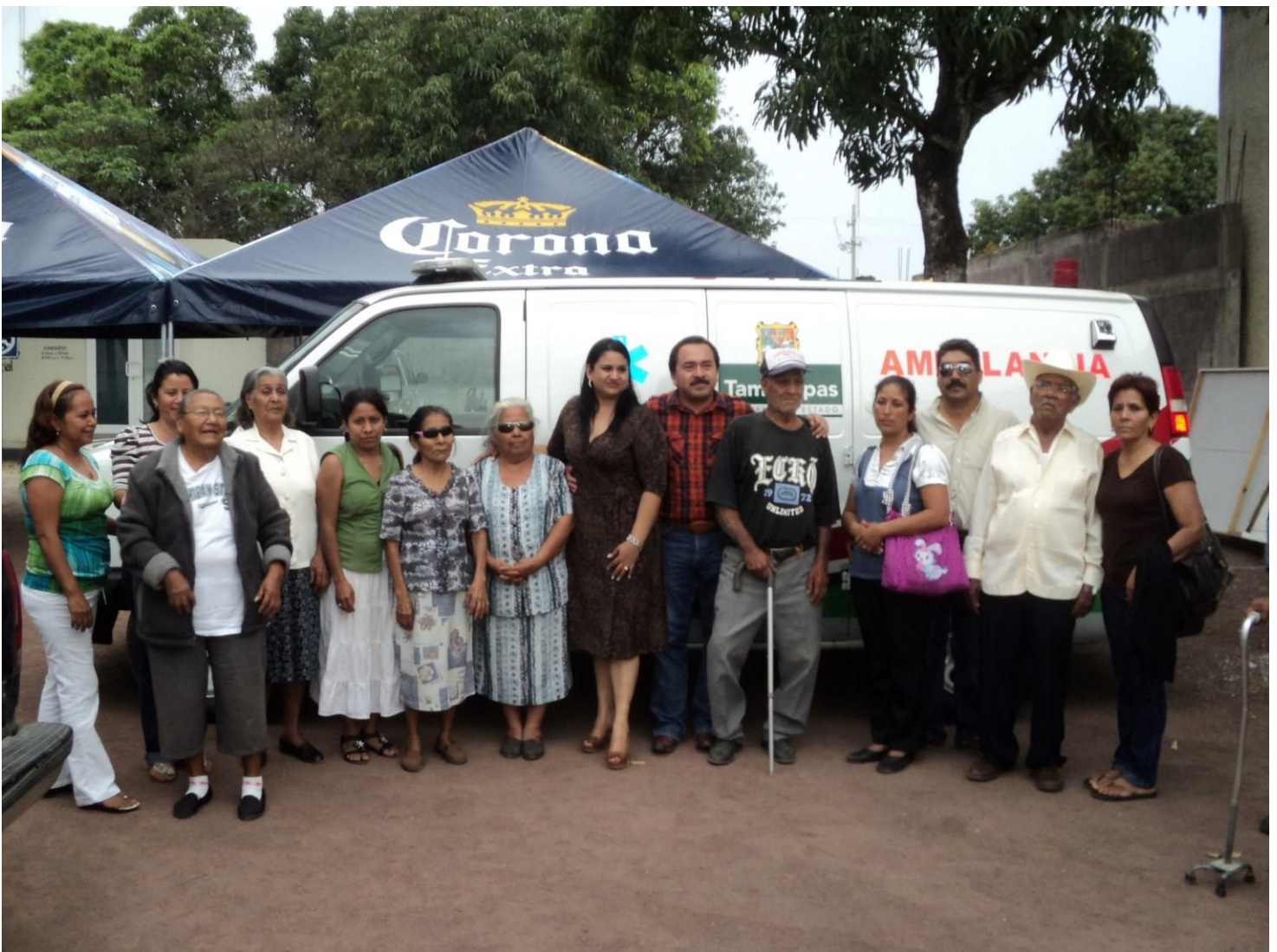
Agradecemos la colaboración de la Presidenta del DIF estatal